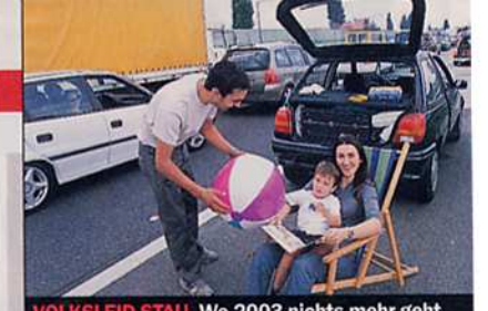
VOLKSLEID STAU. Wo 2003 nichts mehr geht.